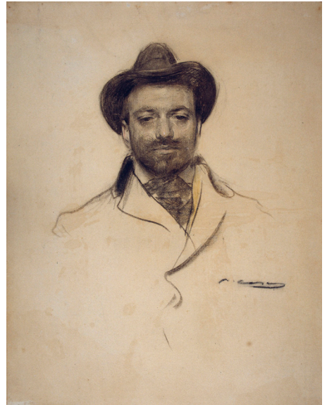
Retrat de Josep Maria Sert, per Ramon Casas (cap al 1904).

Al llarg de la seva carrera, va pintar murals en salons privats i públics arreu d'Espanya, França, Anglaterra i els